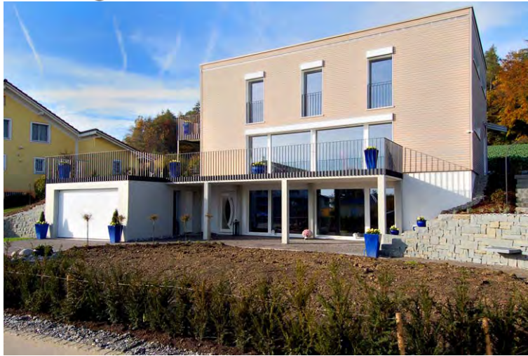
EFH Poletti_B_TG-002P Eco