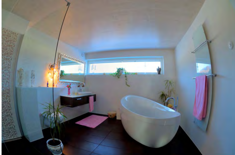
EFH Poletti_J_TG-002P Eco