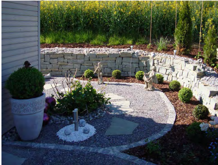
EFH Poletti_Q_TG-002P Eco