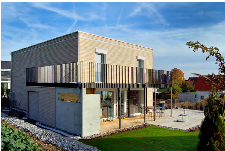
EFH Poletti_K_TG-002P Eco