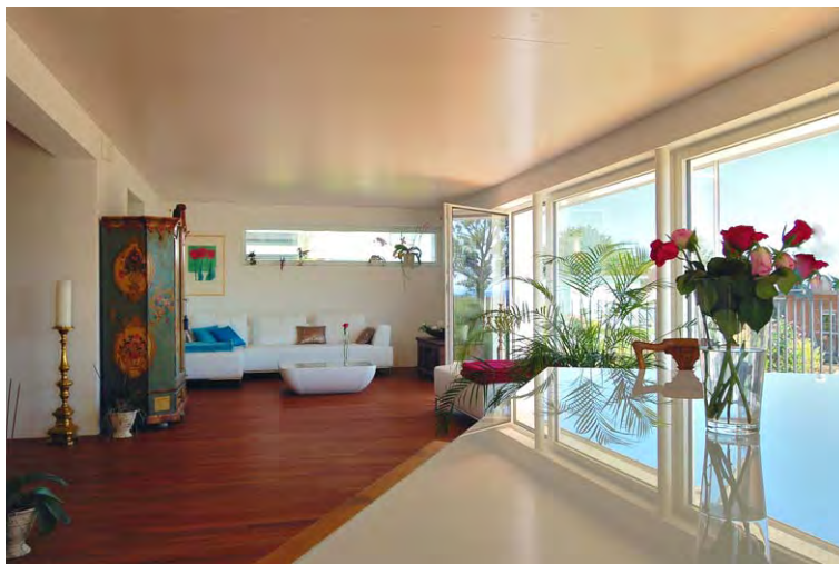
EFH Poletti_F_TG-002P Eco