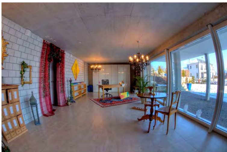
EFH Poletti_G_TG-002P Eco