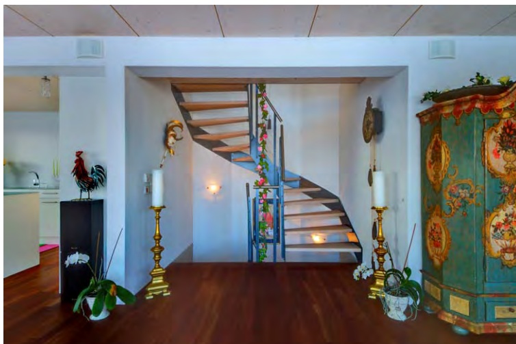
EFH Poletti_I_TG-002P Eco