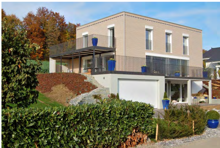
EFH Poletti_A_TG-002P Eco