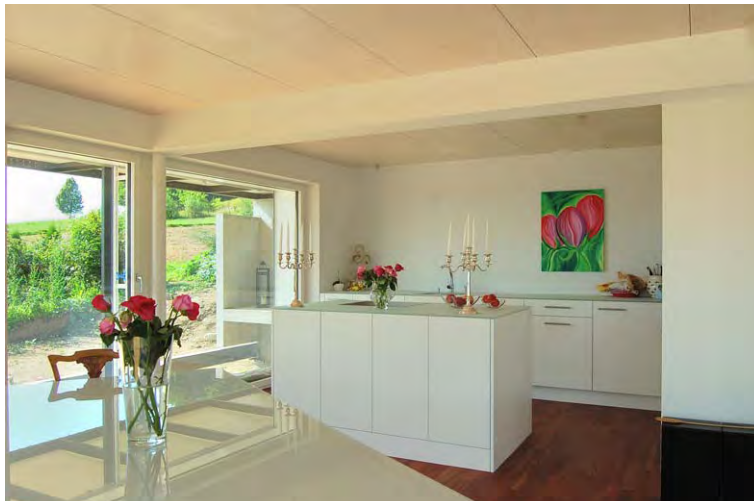
EFH Poletti_H_TG-002P Eco